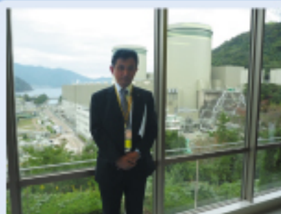
高浜原子力発電所視察