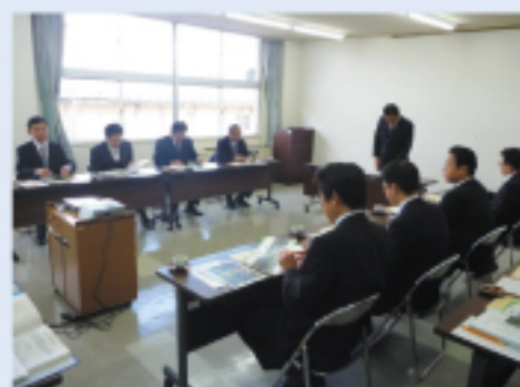
京丹後市 (林道 奥寄線整備)