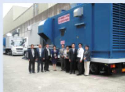
非常用発電機の前で