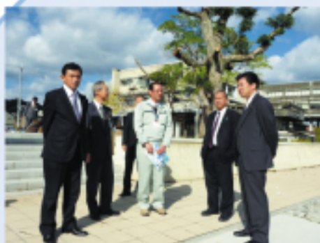
宮津市 (大手川整備)

いつでもお気軽にお立ち寄り下さい。 市民の皆様からのご意見・ご質問も 受け付けております。