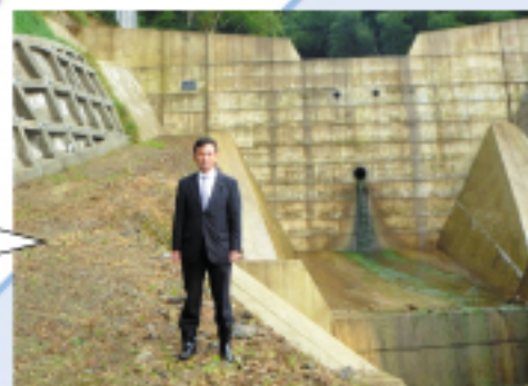
綾部市道屋川(治山事業)