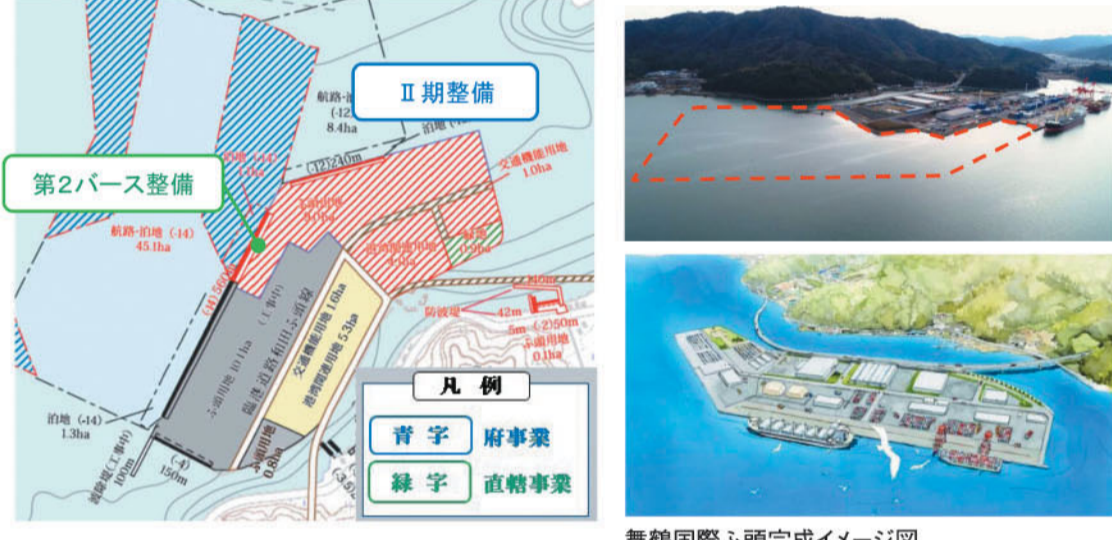
舞鶴国際ふ頭完成イメージ図

お知らせ 「第2ふ頭旅客ターミナル」の改修工事が行われていましたが、この度完成し、新しい「おもてなしの門」をコンセプトに、京町屋風のデザインで、明るい館内を演出しています。3月30日(火)にお披露目の予定です。