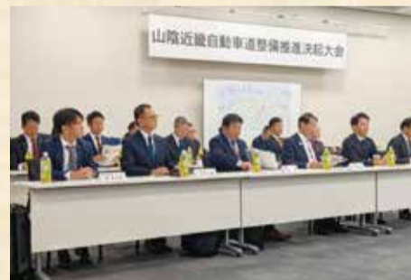
11月18日 山陰近畿自動車道整備促進決起大会