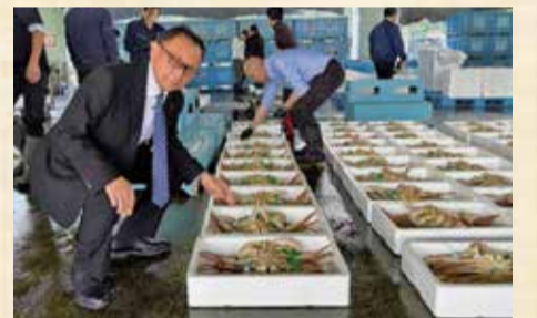
11月6日 舞鶴力二初競