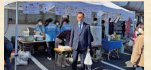
11月16日 南舞鶴ふれあいサンデー