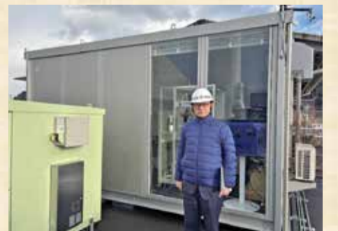
1月29日 水素実証視察(国際埠頭)