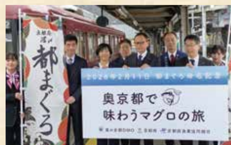
2月11日 都マグロ出発式