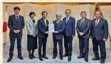
12月11日 大浦振興協要望議会 知事要望