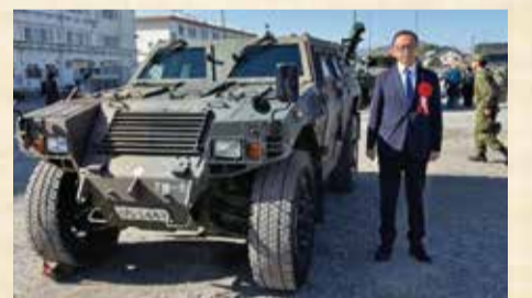
11月30日 陸上自衛隊 福知山