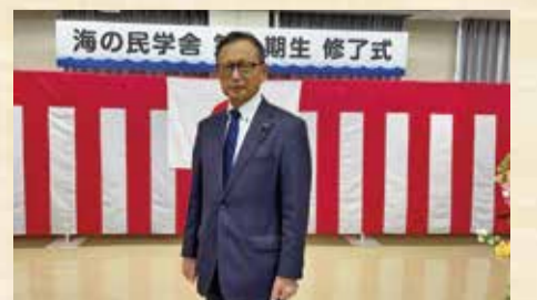
3月13日 海の民学舎修了式